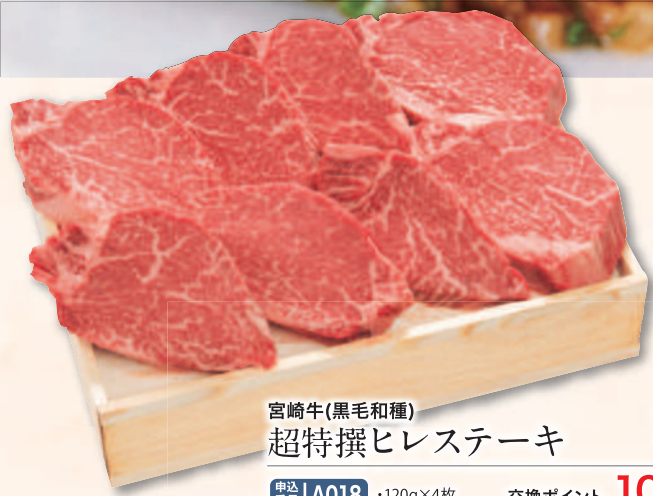
宮崎牛(黒毛和種) 超特撰ヒレステーキ