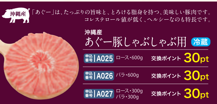
沖縄産 「あぐー」は、たっぷりの旨味と、とろける脂身を持つ、美味しい豚肉です。 コレステロール値が低く、ヘルシーなのも特長です。