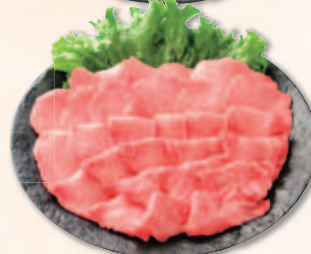
焼肉といえば皆、だいすきな牛タン。 あっさりとしたレモン汁でお召し上がり下さい。 国内産 牛タン焼肉用<解冻>