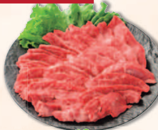
国内産 ハラミ焼肉用<解冻> (一部サガリが含まれます)