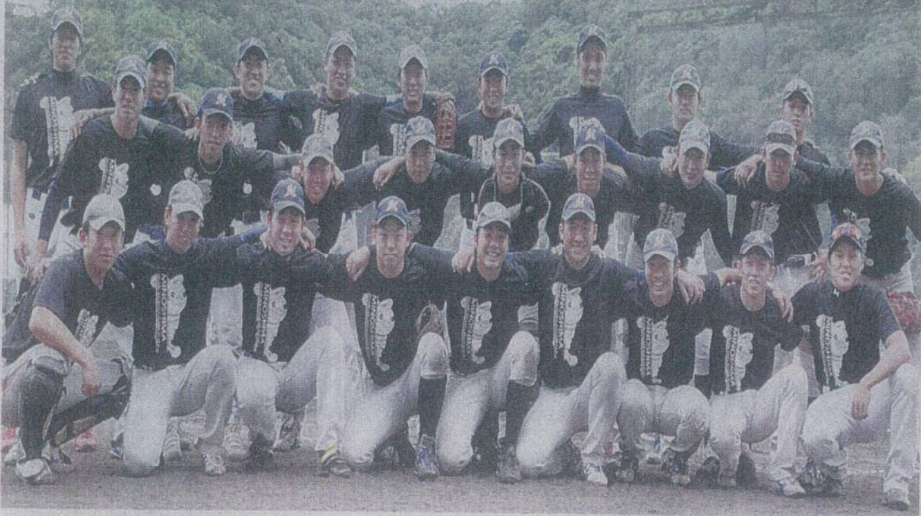
社会人野球日本選手権に向けて意気込む和歌山箕島球友会の選手たち ＝有田市のマツゲン有田球場で

社会人野球チームの 日本一を決める「第43 回社会人野球日本選手 権大会」(毎日新聞社、