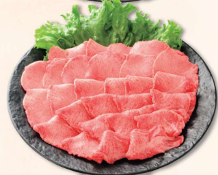
焼肉といえば皆、だいすきな牛タン。 あっさりとしたレモン汁でお召し上がり下さい。 国内産 牛タン焼肉用<解冻>