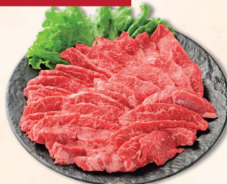
国内産 ハラミ焼肉用<解冻> (一部サガリが含まれます)